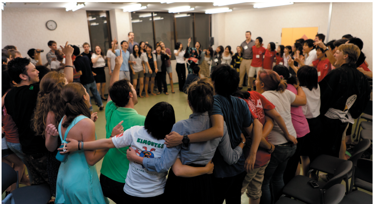
タレントショー後の大合唱