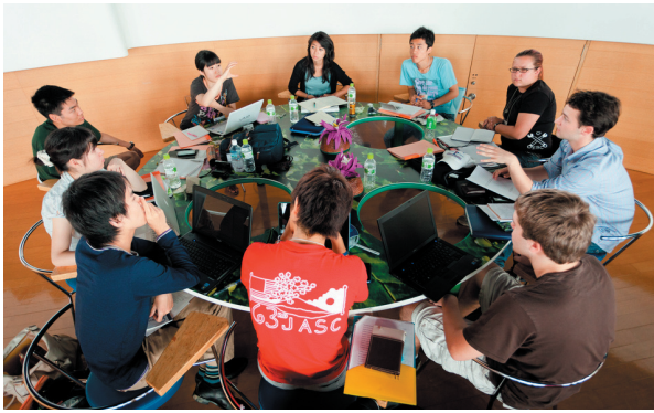
ビュー福島潟での議論の様子