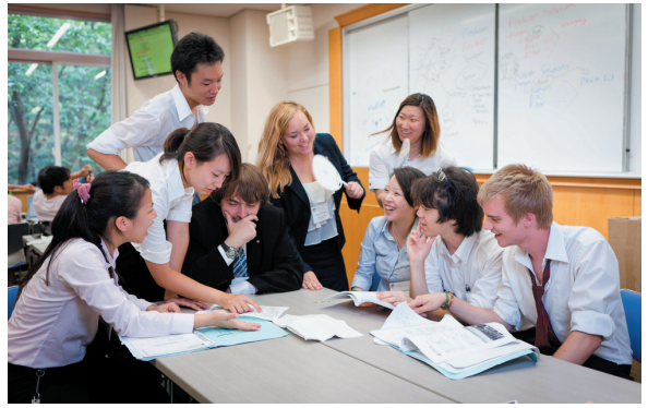
ファイナルフォーラム前の分科会の様子