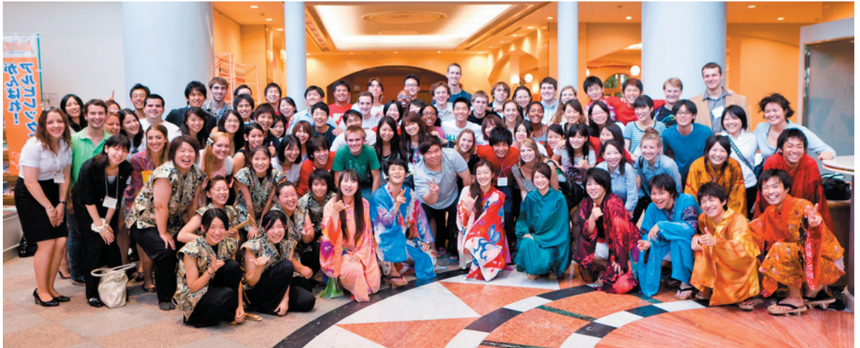
新潟下駄総踊り観賞後、踊り子の方々と